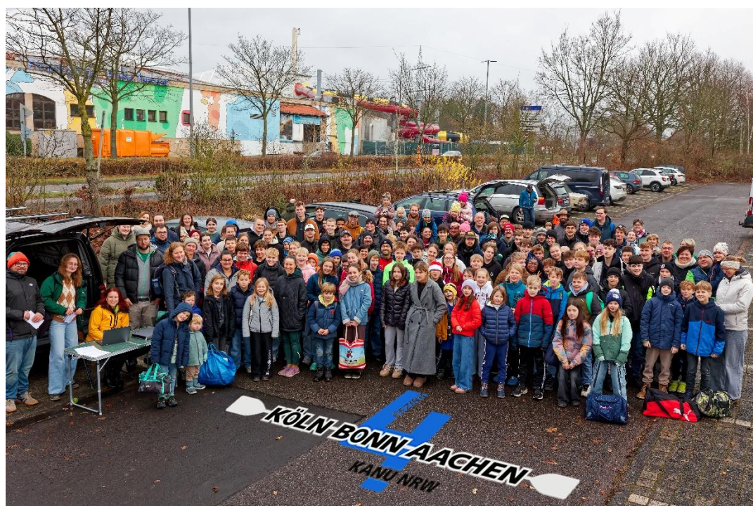
Jahresabschluss beim Weihnachtsschwimmen am 13.12.2025

Als Jahresabschluss stand dann noch unser mittlerweile auch traditionellen Weihnachtsschwimmen auf dem Programm. Wir organisieren diese Veranstaltung schon viele Jahre und haben sie mittlerweile auch für Vereine aus dem Kanuverband NRW geöffnet. Mit 183 Paddlern aus 16 verschiedenen Vereinen wurden das Wasser und vor allem die Rutschen unsicher gemacht.